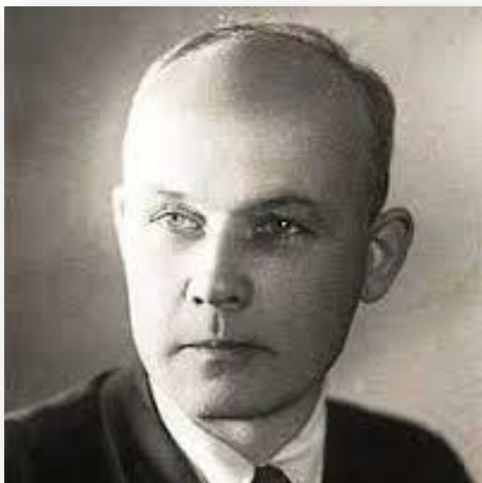
Старокадомский Михайл Леонидович - советский композитор, органист и педагог.