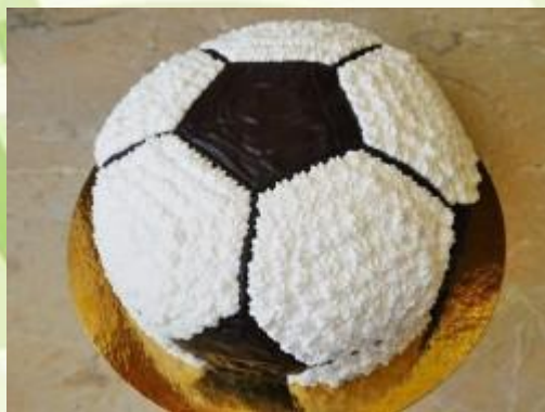
Ингредиенты для торта "Футбольный мяч"

После проведения семейного футбольного матча, можно переключиться на другую деятельность. Например, изготовить совместный торт "Футбольный мяч"